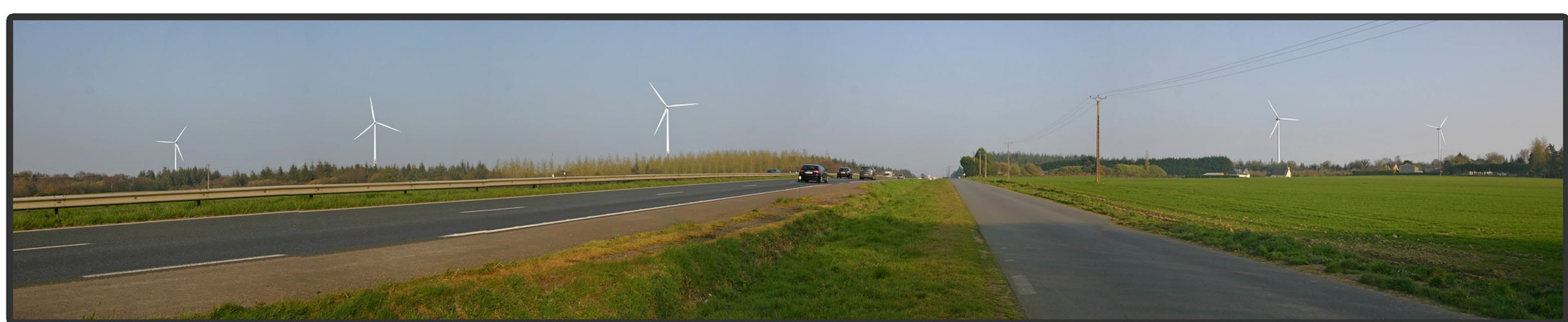
Photomontage panoramique illustrant l'implantation du projet éolien de Ploumagoar (distance entre le point de vue et l'éolienne la plus proche = 920m)